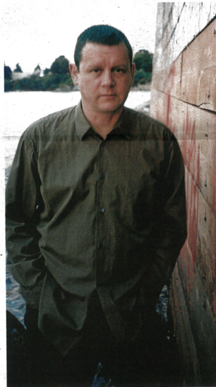
Jeff Wall es autor de una obra visual muy singular. :: DESVELO

Además de las numerosas exposiciones internacionales en las que ha sido mostrada su obra, las retrospectivas que le dedican la Tate Modern